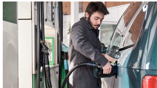
Rellenar gasolina y electricidad