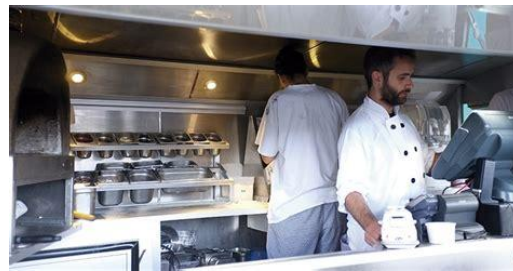
Cocinar la comida