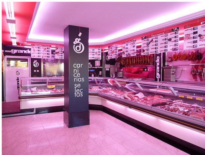
Dehesa Grande S. Coop. (Vitigudino)