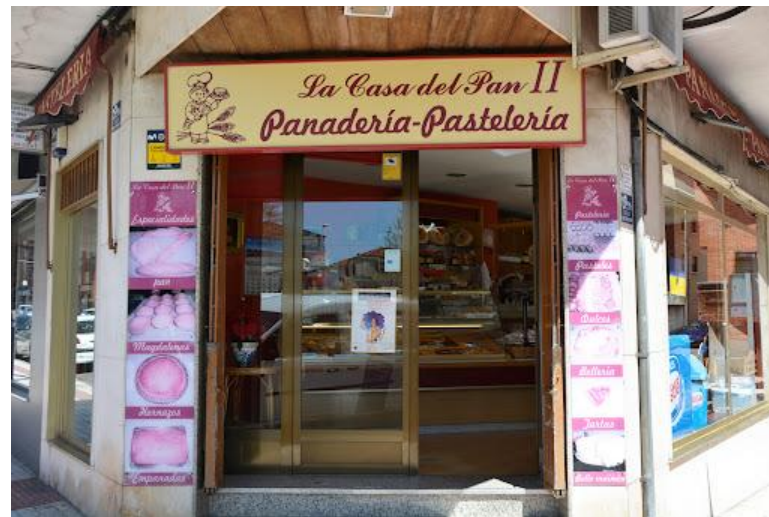
La Casa del Pan