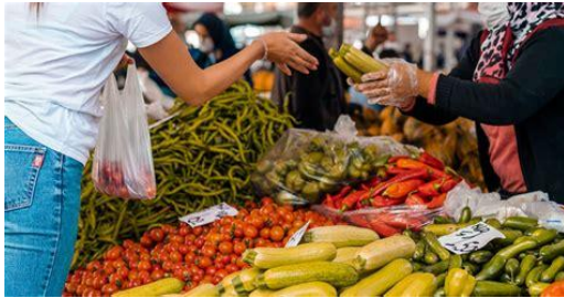
Comprar los ingredientes