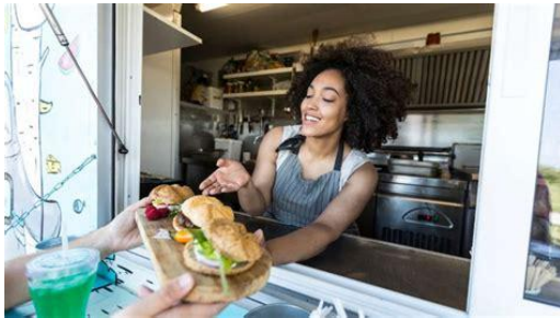
Vender la comida