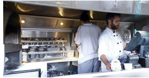
Cocinar la comida