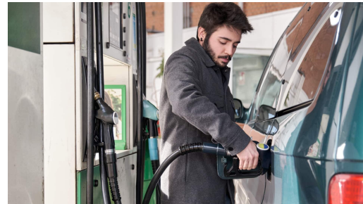
Rellenar gasolina y electricidad