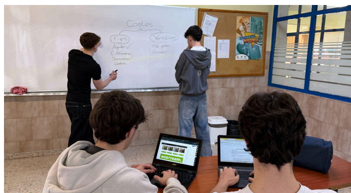
Integrantes del grupo Ecocream trabajando.

Por último, gestionar de manera óptima la logística y la distribución es una actividad muy importante para garantizar la llegada del producto en condiciones óptimas a los puntos de venta tanto físicos como a los consumidores finales mediante la vía online. Esta actividad incluye tanto la planificación de envíos, como el control del stock y la coordinación con los distribuidores locales, pudiendo externalizar parcialmente siempre que se mantengan los estándares de calidad definidos por la empresa.