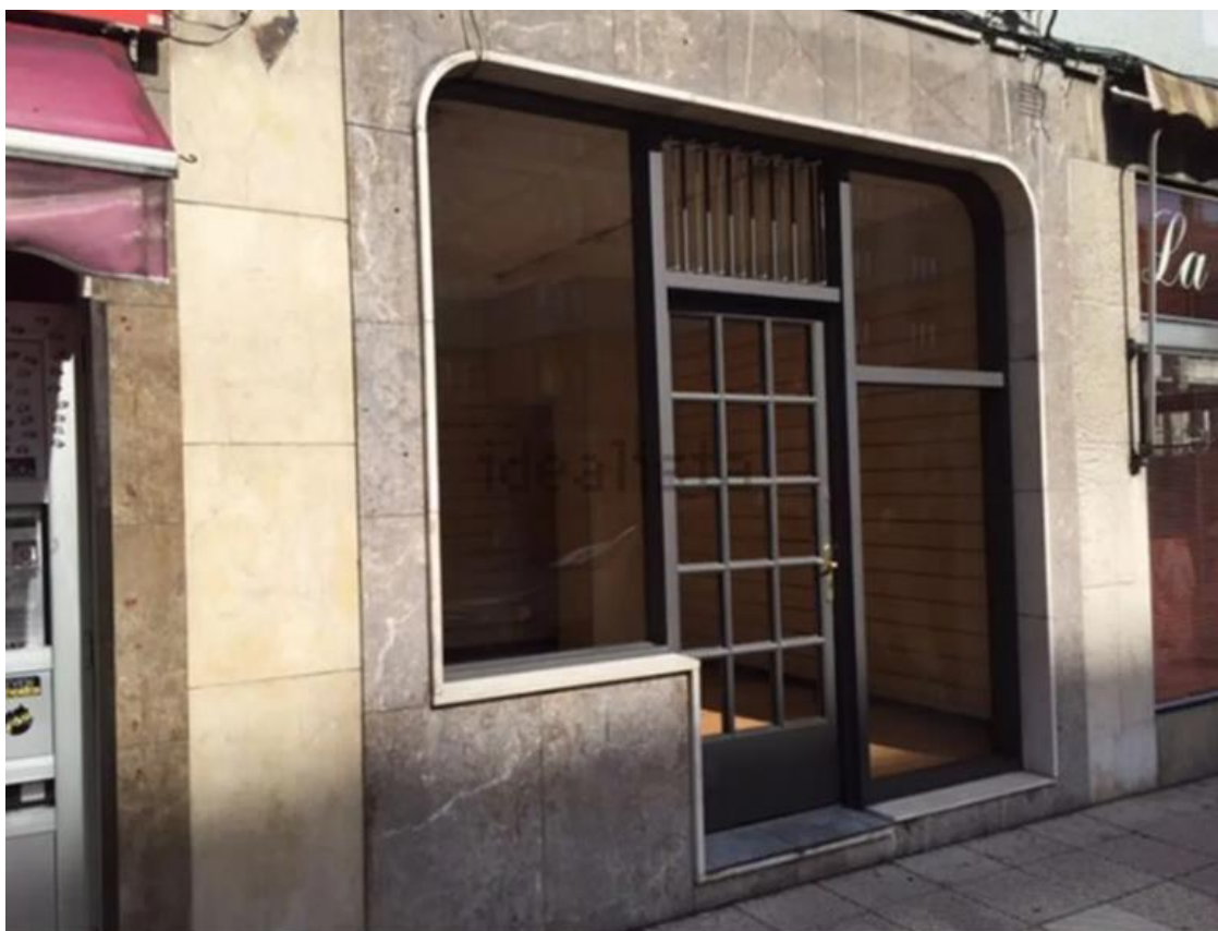
Figura 1. Fachada del local

Se trata de un local muy vistoso y por donde transita un gran número de personas y vehículos. Además, la poca presencia de empresas comercializadoras de fajas cercanas, hacen que cuente con las condiciones esperadas para la empresa.