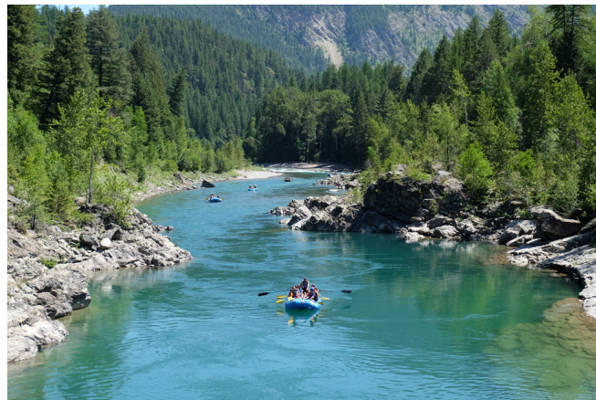
Imagen 2: Rafting en el lago