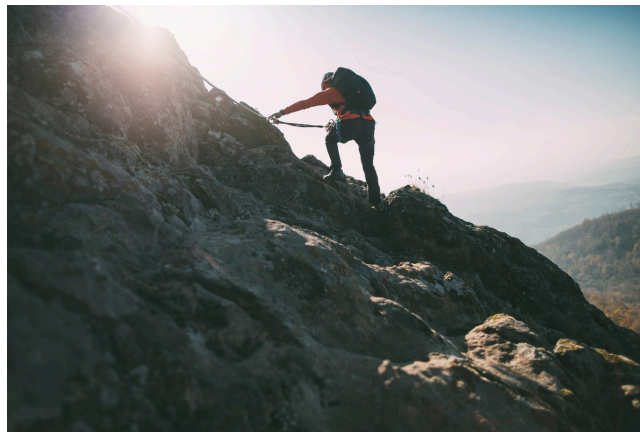
Imagen 5: Realizando escalda