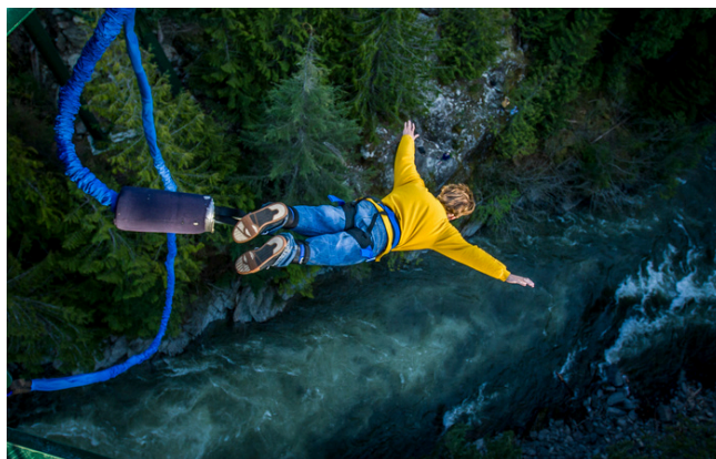
Imagen 4: Realizando puenting