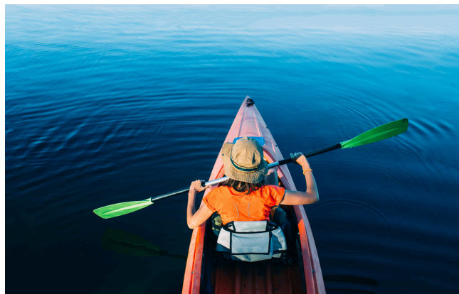
Imagen 3: Haceindo Kayak