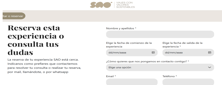
Captura de reserva viajes