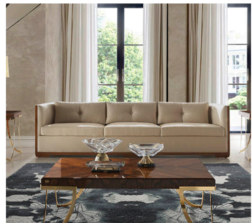
IMAGEN MUEBLES DE LUJO SOHER

Por último, con el fin de complementar todas estas actividades, usamos procesos que innoven y mejoren estos de forma continua con el fin de optimizar la carpintería, actualizar maquinaria, mantenerse al día a las tendencias y digitalizarse . Esto nos permite evolucionar como marca y ofrecer productos competitivos dentro del mercado de lujo y mantener una propuesta sólida basada en la exclusividad y calidad .