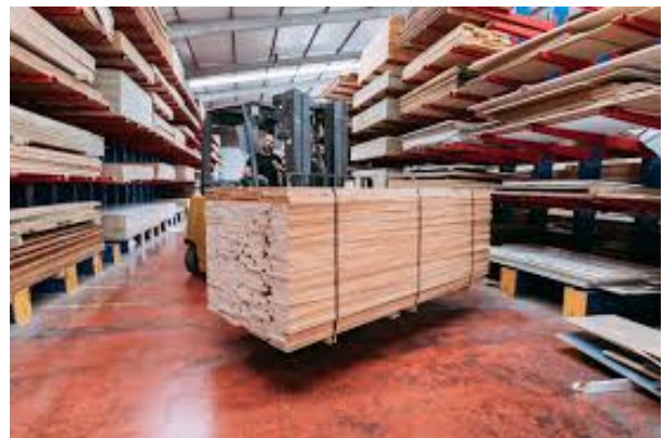
IMAGEN ALMACEN MADERA

En cuanto a actividades de la empresa nos enfocaremos en asegurar principalmente la producción de los muebles utilizando la madera Buloke , uno de los materiales más resistentes. Uno de los primeros procesos más fundamentales será el almacenamiento de la madera bruta la cual se realiza en espacios controlados que ayudarán a mantener una ventilación y humedad adecuados . Esto evita deformaciones y conserva sobre todo la calidad de la madera hasta el proceso de producción.