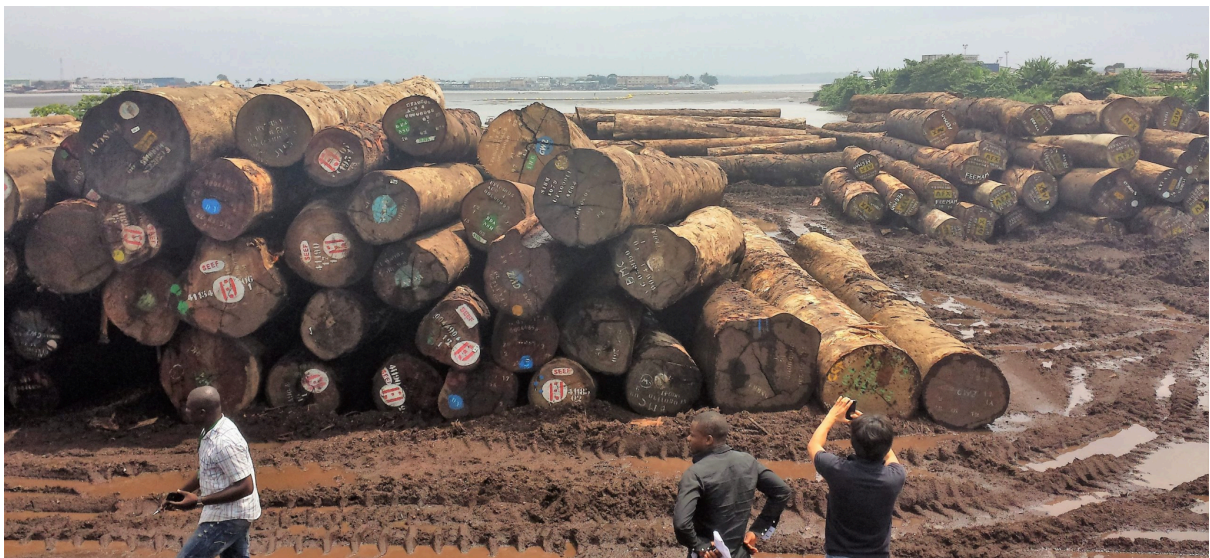
IMAGEN CAMEROON TIMBER

La empresa Cameroon timber será uno de nuestros principales aliados ya que nos permitira acceder de forma directa a proveedores y explotaciones forestales especializadas en el desarrollo y suministro de materias primas bajo criterios de calidad y sostenibilidad. A traves de esta empresa lograremos abastecernos de la materia prima necesaria para nuestro mobiliario asi garantizando nuestros estandares de calidad, estetica y durabilidad. Ademas facilitara el acceso directo con productores, artesanos y distribuidores de confianza lo que optimizara el proceso de aprovisionamiento, control de calidad y distribucion.