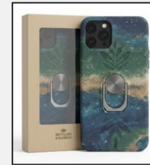
Funda Premium 18,00€