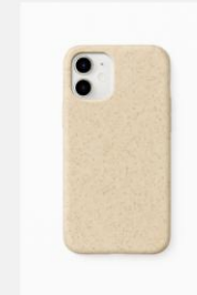
Funda Estándar 15,00€