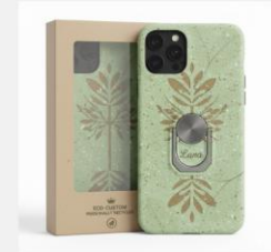
Personalización ecológica +4€