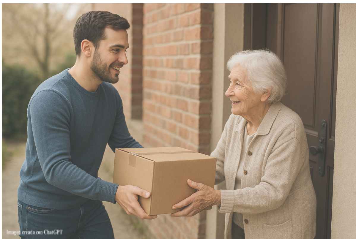
Imagen creada con ChatGPT

En definitiva, LaborApp quiere ser una solución cercana para un problema muy real. Ayuda a quienes necesitan ingresos a encontrar tareas rápidas y ajustadas a su tiempo, y también facilita que cualquier persona pueda encontrar ayuda para sus necesidades diarias sin complicaciones, y al precio que él vea justo. Esa mezcla de sencillez, utilidad y una experiencia pensada para la gente de a pie es lo que convierte a LaborApp en una propuesta sólida y atractiva para cualquier usuario.