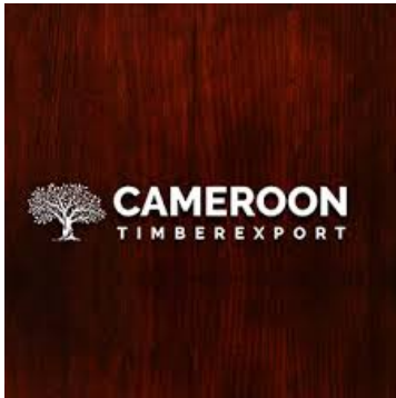
IMAGEN LOGO CAMEROON TIMBER

En cuanto a sociedades clave nuestro principales aliados serán la empresa Etsy , la industrial Rosmil y el distribuidor Posta .