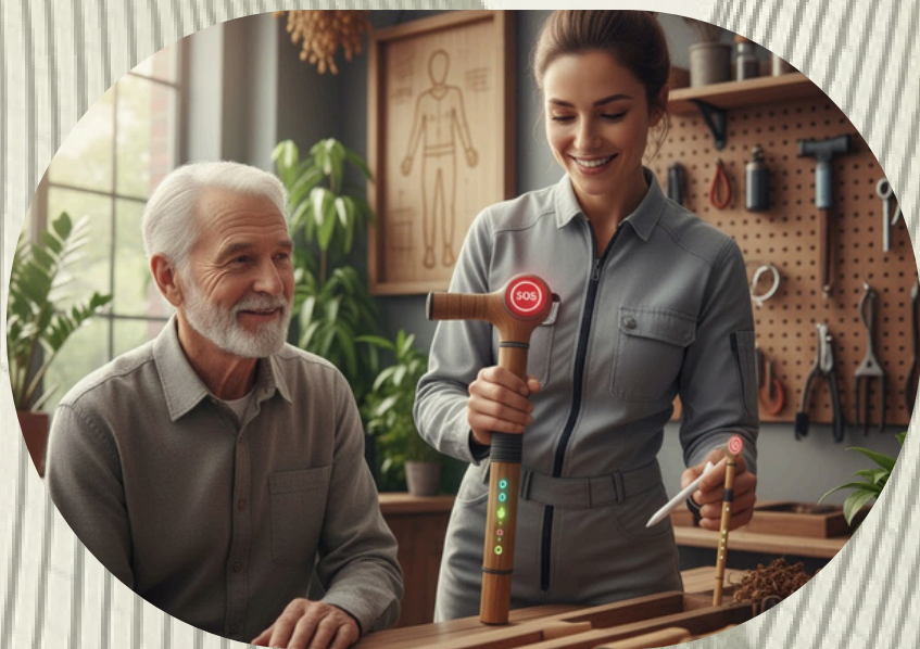
1 - ATENCIÓN PERSONALIZADA Y SOPORTE TÉCNICO.