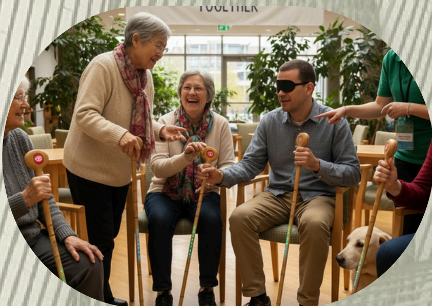
3 - COMUNIDADES DE USUARIOS