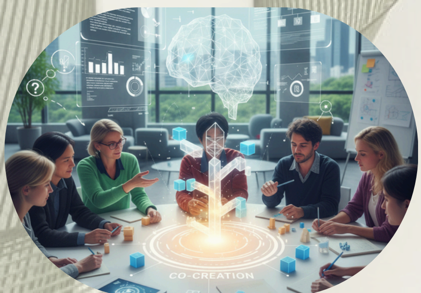
4 - COCREACIÓN