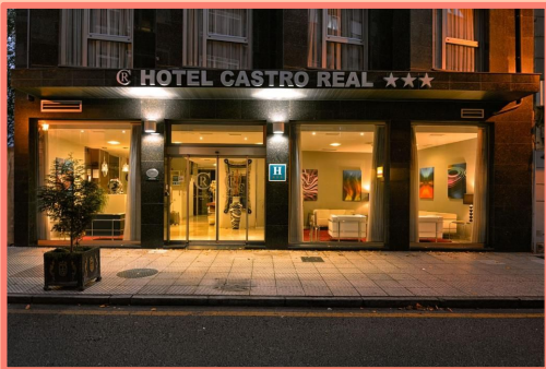
HOTEL CASTRO REAL (OVIEDO)