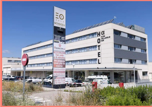
HOTEL ALDA VALLADOLID SUR (VALLADOLID)