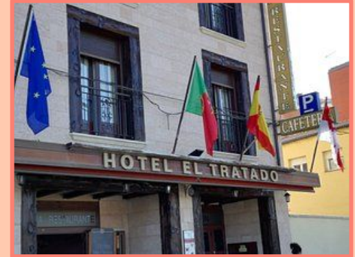
HOTEL EL TRATADO (TORDESILLAS)