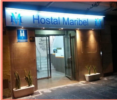
HOTEL MARIBEL (ALMERÍA)