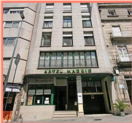
HOTEL MADRID (PONTEVEDRA)