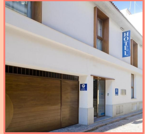
LA BOUTIQUE PUERTA OSARIO (CÓRDOBA)