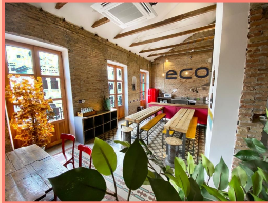
ECO HOSTEL (GRANADA)