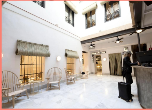
U-SENSE FOR YOU HOTEL (SEVILLA)