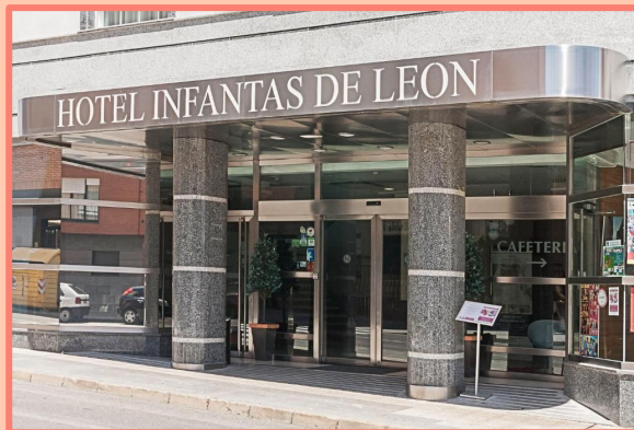
FC INFANTAS DE LEÓN (LEÓN)