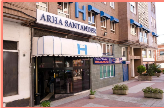
HOTEL ARHA SANTANDER (SANTANDER)