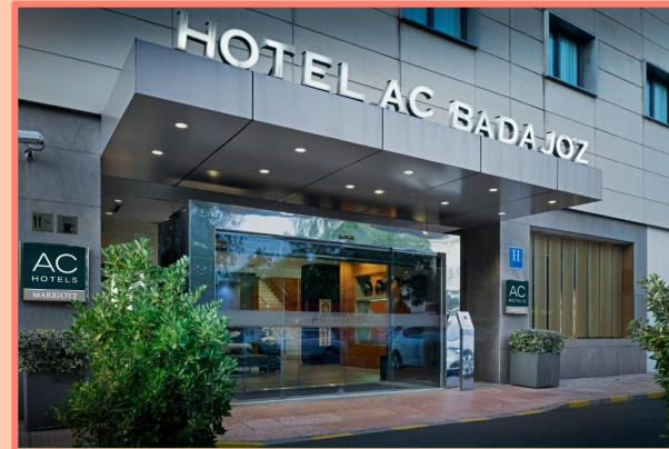
HOTEL AC BADAJOZ (EXTREMADURA)