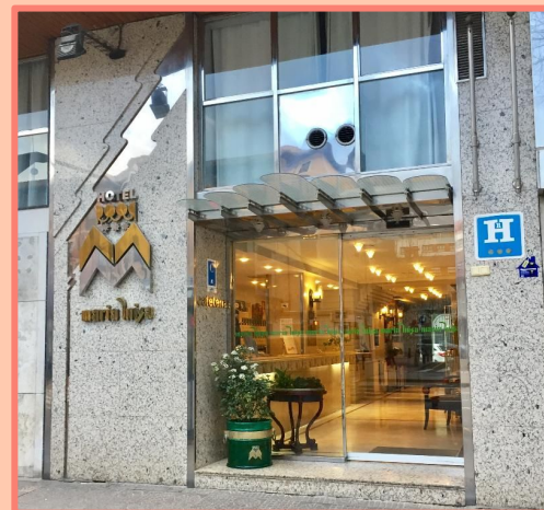
HOTEL MARIA LUISA (BURGOS)