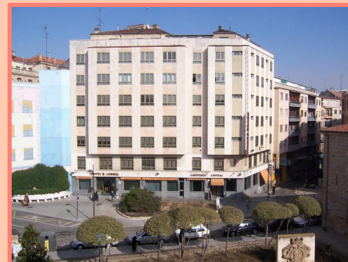
HOTEL CONDAL (SALAMANCA)