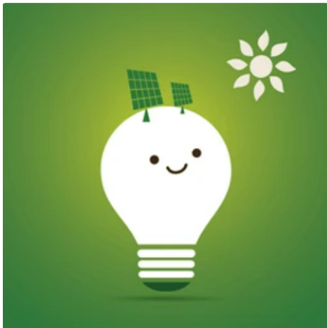
Imagen que representa nuestro proyecto:

Con este proyecto lo que tenemos como objetivo es que a la población se le proporcione un menor gasto de energía y económico, aprovechando la energía renovable y reduciendo gastos.