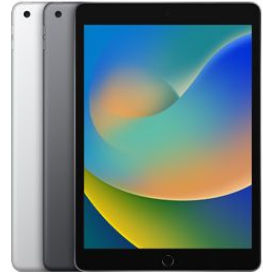
iPad (9.ª generación)