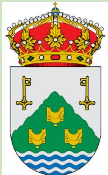
Ayuntamiento de Tordesillas