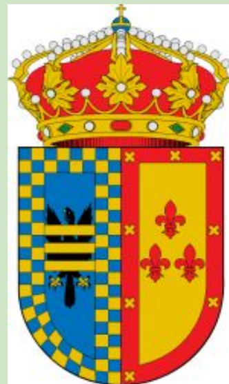
Ayuntamiento de Serrada