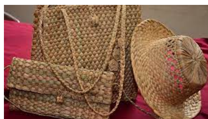
Beste batzuk: 5-30€