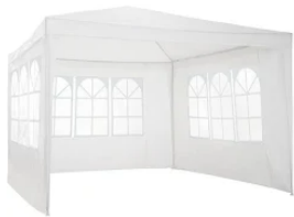
tectake Carpa 3x3m con 3 paneles laterales - blanco ...

Gure kasuan ez degu lokal bat beharko, bi astetan behin herriz herri joango garelako gure pultserak ezagutarazteko. Karpa bat erosi beharko dugu gure bezeroekin harremanetan jartzeko. Karpak 3x3 metro karratu neurtuko du eta 76,99€ ordainduko dugu horregatik. Hortaz gain, mahai bat erosiko dugu 39,90€-an eta horrekin batera bost aulki erosiko ditugu 7,87€-tan.