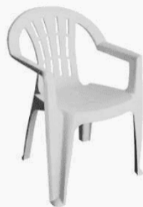
Silla con Brazos Rayas