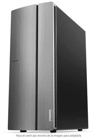
Pasa el ratón por encima de la imagen para ampliarla

Lenovo Ideacentre 510-15ICB - Ordenador de sobremesa (Intel Core i5-8400, 8GB RAM, 512GB SSD, Intel HD Graphics, Windows10) Plateado - Teclado QWERTY español + Ratón USB