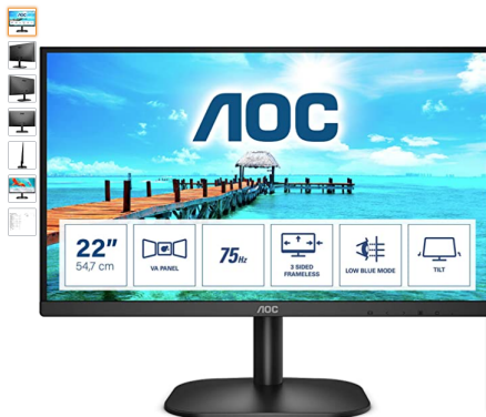
Pasa el ratón por encima de la imagen para ampliarla Etiqueta de eficiencia energética | Ficha de producto

AOC Monitor 22B2H- 22" Full HD, 75Hz, VA, Flickerfree, 1920x1080, 200cd/m, D-SUB, HDMI