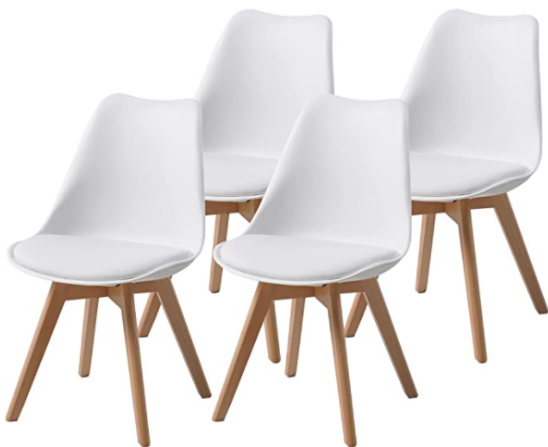
Pasa el ratón por encima de la imagen para ampliarla