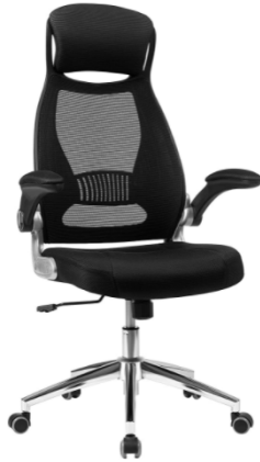
Pasa el ratón por encima de la imagen para ampliarla