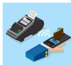
A través del móvil