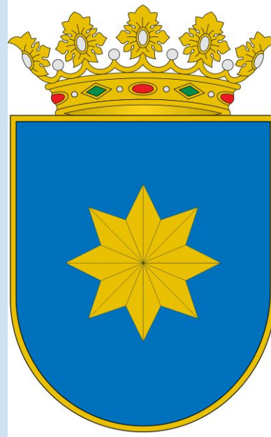
AYUNTAMIENTO DE ALAEJOS