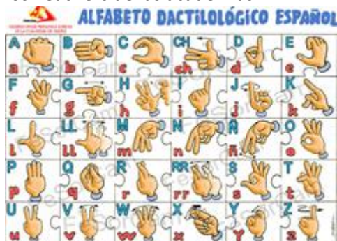
Lengua de Signos Española DIAS DE LA SEMANA

Nuestra idea es que la escuela funcione como una academia de inglés, ya que es una extraescolar. Los profesores deberán de ser personas que sean nativas en esta lengua, como los Teachers de las academias.