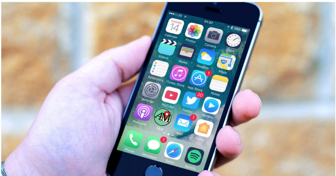
En la parte inferior, vemos un prototipo de logotipo de como se vería en la app