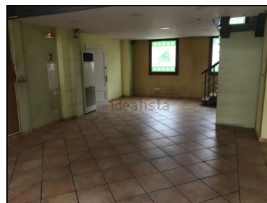
Bulegoa eta bezeroekin harremanan egoteko gunea