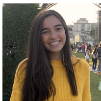
Marta Vila Marketing y Publicidad