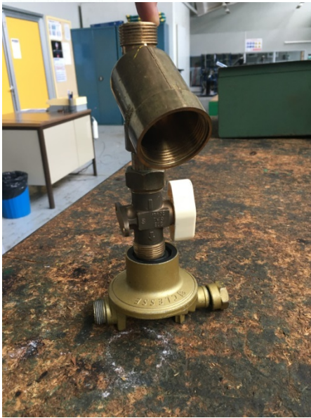
Lámpara de mesa