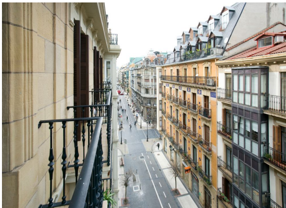
( TIENDA FÍSICA )

Nuestra tienda física estará situada en la C/San Marcial. Hemos elegido esta localización porque pensamos que está en un sitio muy bien situado ya que está siempre frecuentado por personas y así, nuestro producto puede ser conocido por muchas más personas. También alquilaremos una nave más amplia para que nuestros trabajadores puedan trabajar en un espacio más amplio, mejor y más cómodos.