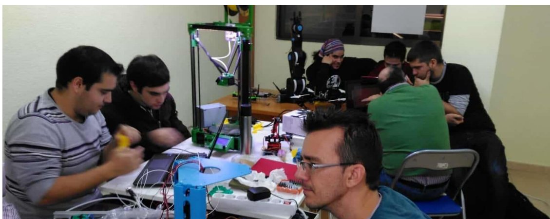
Jornada de trabajo en La Caja Maker Space en la que aparecemos algunos de nosotros

Los Makers proceden de muy diversos ámbitos del mundo tecnológico pero, tenemos en común, la pasión por la tecnología, compartir conocimiento en un entorno de innovación en red y crear nuevos dispositivos inteligentes como robots, drones, dispositivos portátiles... a partir de la tecnología que tenemos a nuestro alcance. Nuestro espacio físico de encuentro y desarrollo de proyectos es La Caja Maker Space http://www.lacajamakerspace.org/