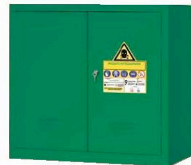
Armario para los fitosanitarios