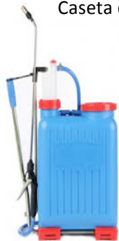
Mochila para tratamientos

Caseta de aperos en la que tendremos las herramientas de trabajo