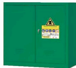
Armario para los fitosanitarios