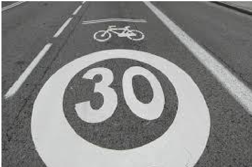
Carriles especiales en carreteras comarcales.