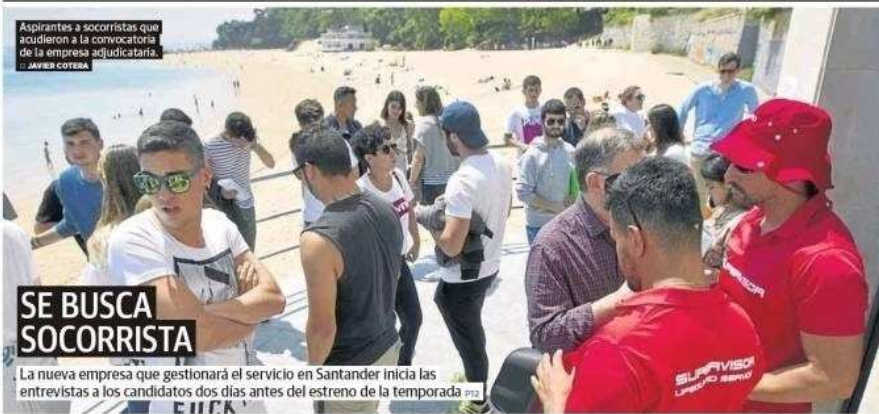
Aspirantes a socorristas que acudieron a la convocatoria de la empresa adjudicataria. JAVIER COTERA

de la proclamación. Don Felipe ya estuvo en 2014 con motivo de la celebración del Mundial de Vela en Santander. JOSE AHUMADA P4