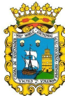
AYUNTAMIENTO DE SANTANDER