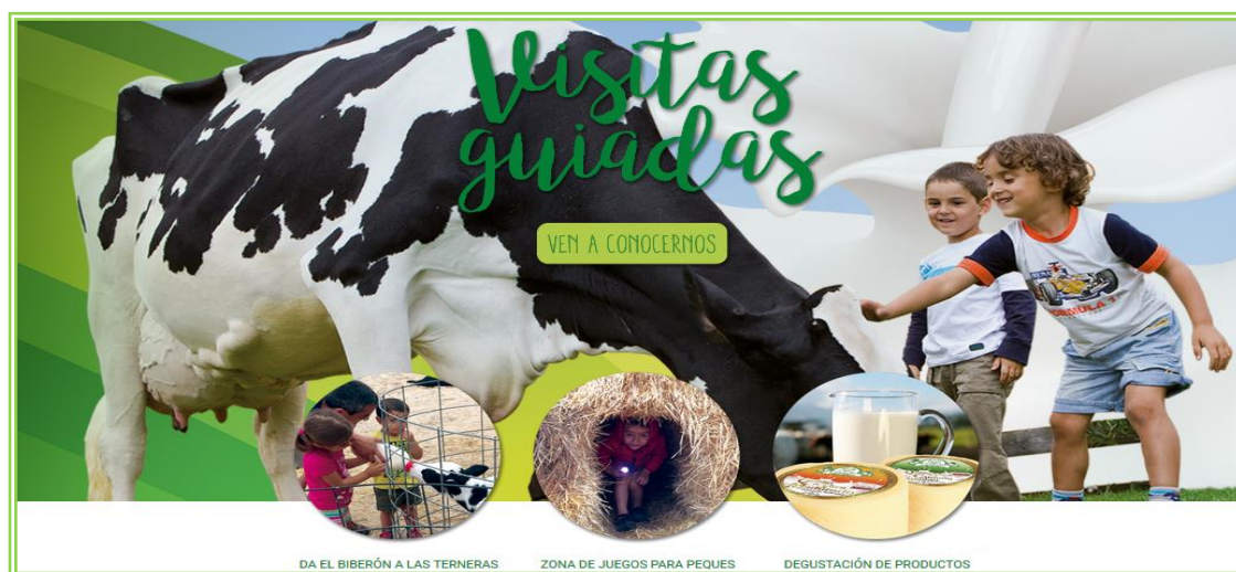
Imagen 9 – Fuente: http://www.granjacudana.com/ (Consultado el 08/01/2018).