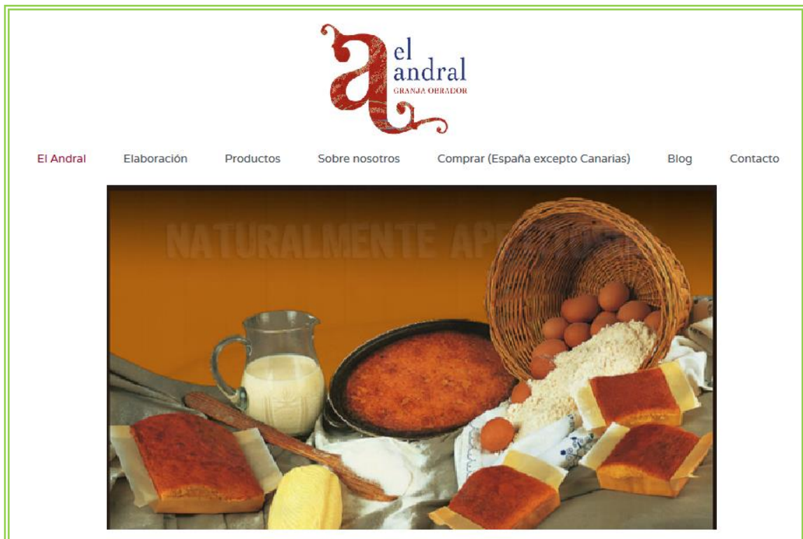
Imagen 13