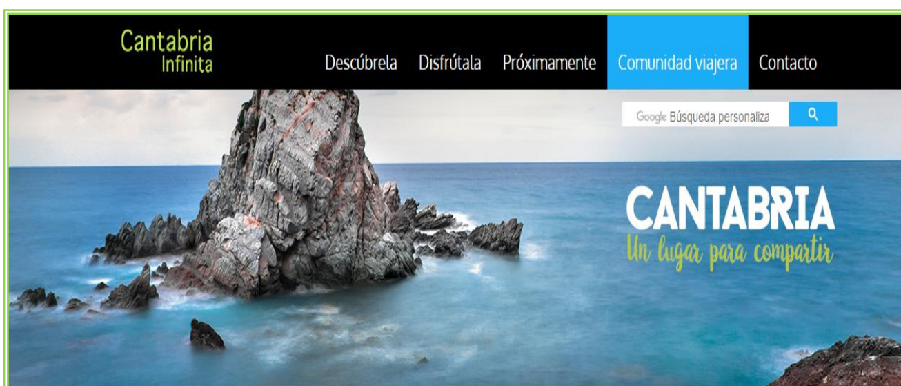
Imagen 16

Así, como excursiones programadas con visitas guiadas a los pueblos de nuestra provincia, para que puedan conocer nuestra historia, y sus monumentos, paisajes, o cuevas de interés, a las que se puede tener acceso a través del portal de Cantabria Infinita.