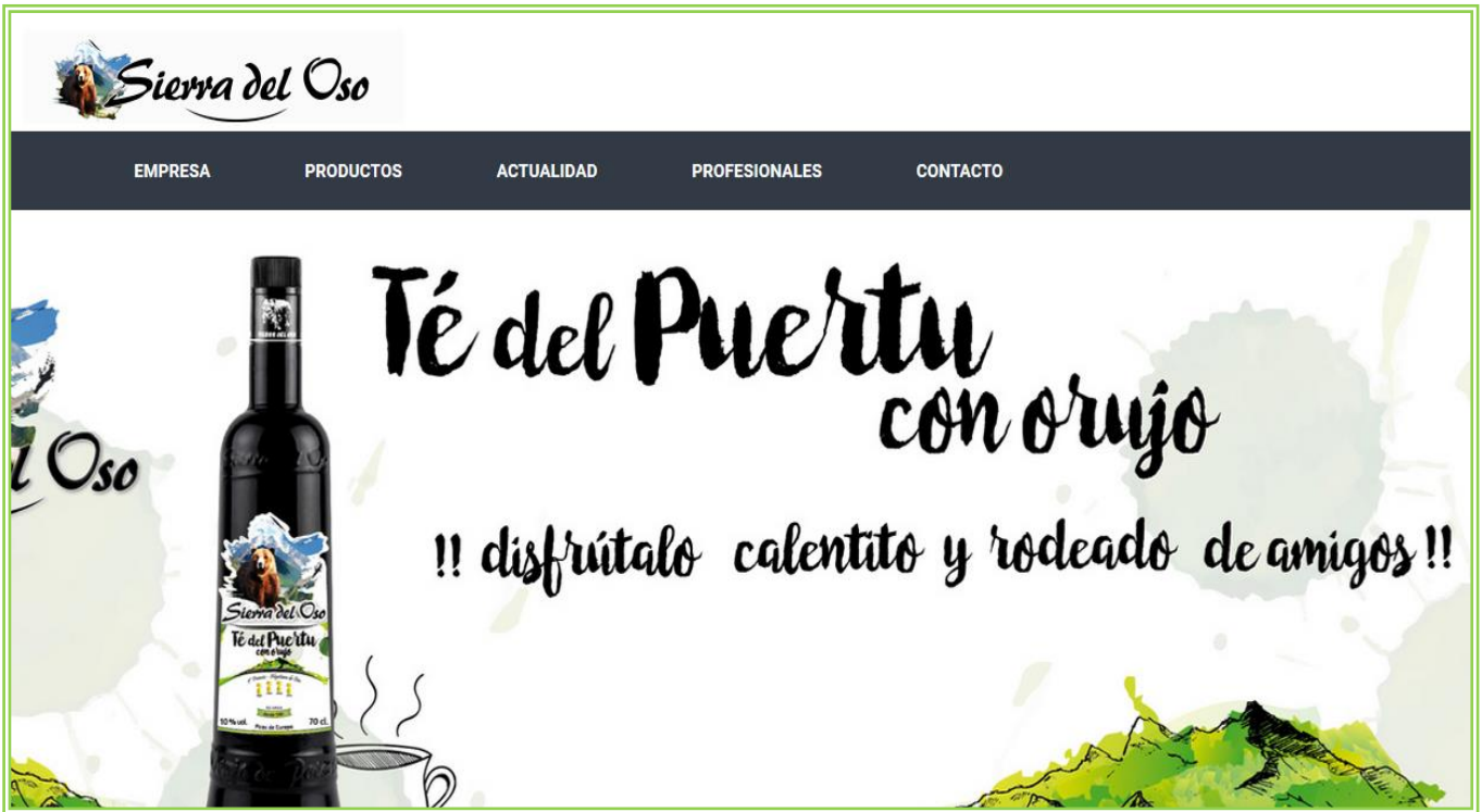
Imagen 14