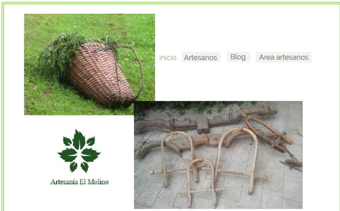
Imagen 15