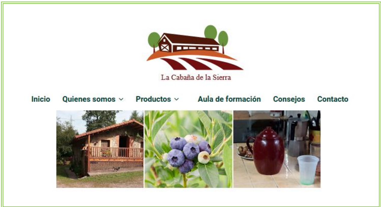
Imagen 10 – Fuente: elaboración propia.