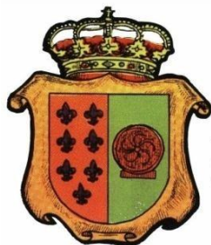
Excmo. Ayuntamiento de Los Corrales de Buelna