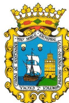
AYUNTAMIENTO DE SANTANDER