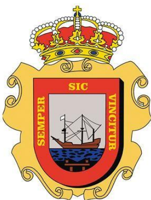
Ayto. de Astillero