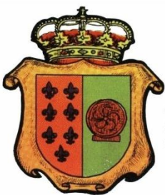
Excmo. Ayuntamiento de Los Corrales de Buelna