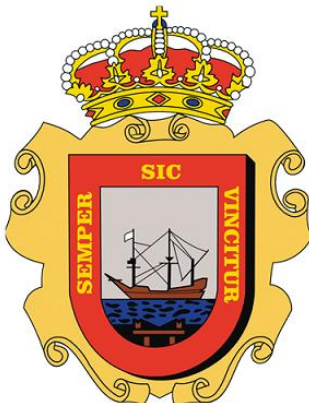
Ayto. de Astillero