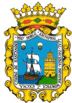
AYUNTAMIENTO DE SANTANDER