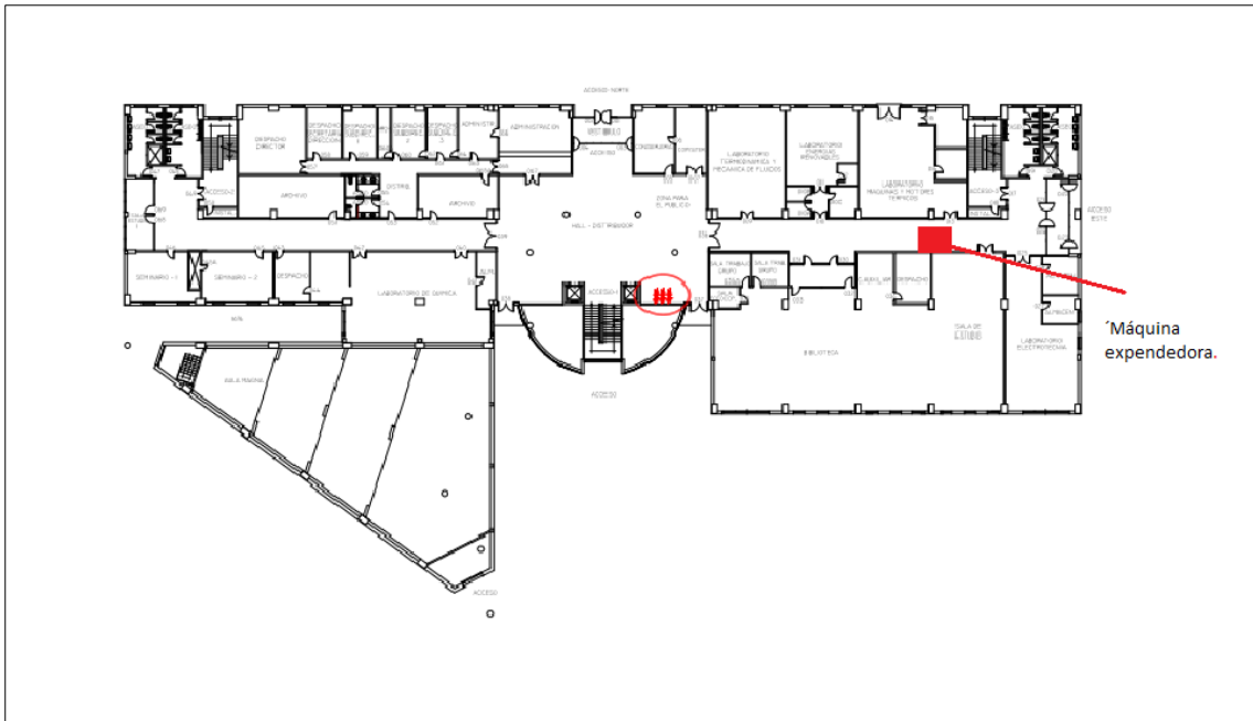
Figura 2: -En la imagen anterior está reproducido el plano de la Escuela Politécnica de Minas y Energía, sita en Torrelavega.

A continuación hemos establecido dos ejemplos de ubicación de nuestras maquinas en el campus de Santander y Torrelavega.