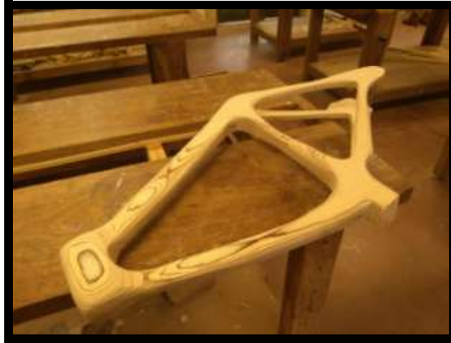
IMAGEN DEL CUADRO DE MADERA