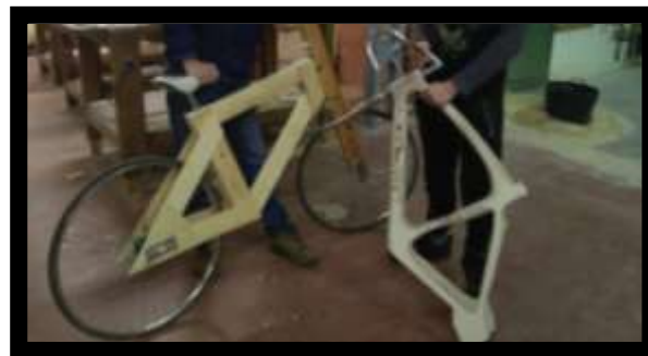
BICICLETA FABRICADA CON UN CUADRO DE MADERA SENCILLO E IMAGEN DEL CUADRO DE MADERA FABRICADO