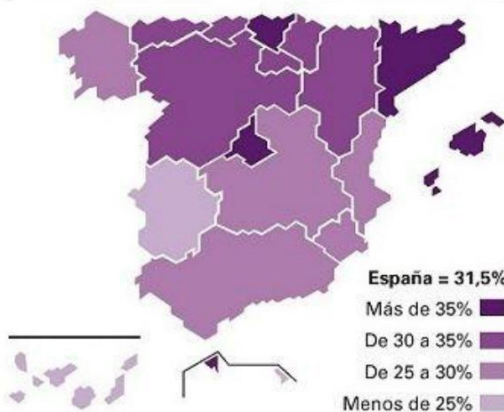
Personas que compraron por Internet en los últimos 12 meses. 2013 (% personas de 16 a 74 años)